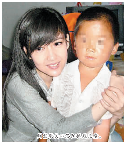
周慧敏关心洛阳孤儿儿童。

大大的轮椅上坐着一个瘦弱的小孩，细小的双腿不停地晃动着，村里的路虽然平坦，但靠手转轮前行的他，看上去仍显得非常艰难……轮椅上的小男孩叫张国强，今年9岁。5月20日，本报刊登《“六一”前，“寄养村”里听童声》一文，引起香港著名影星周慧敏的关注。