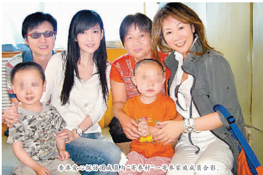
香港爱心探访团成员与“寄养村”一寄养家庭成员合影。